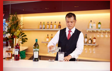
ラウンジサービス Lounge Service

安全で快適に飛行できるルートや高度、気象状況などの情報を各部署に提供します。航空機内の荷物のバランスを計算する等、空港オペレーション機能の中枢を担っています。