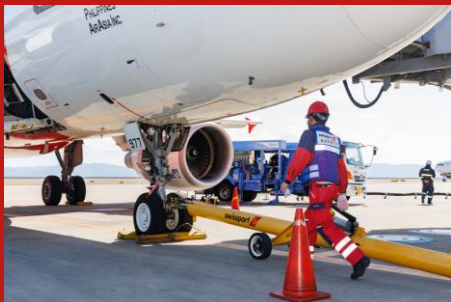
ランプサービス Ramp Service

成田国際空港内のラウンジで提携エアラインのお客様が利用します。お客様の搭乗されるまでのお時間を快適に過ごせるよう受付・案内・飲食提供等のサービスを提供します。