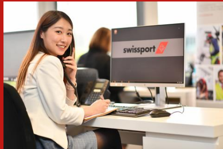
オペレーションサービス Operation Service

空港で最初にお客様をカウンターでお出迎えます。空港に来たお客様が安心して旅立てようカウンターから搭乗までのお客様対応を全てサポートします。