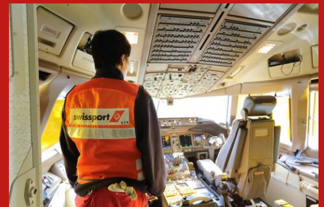
メンテナンスサービス Maintenance Service

空港でランプサービスより受け取った貨物を保管し管理します。預かった荷物を梱包や仕分け、代理店との連携を取り、お客様の元に無事に送り届ける使命を担っています。