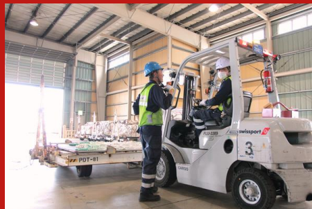
カーゴサービス Cargo Service

到着した飛行機の誘導(マーシャリング)から貨物の積み下ろし、ブリッジ操作・離陸準備(プッシュバック)・お見送りまでを出発時間までにチームで遂行します。