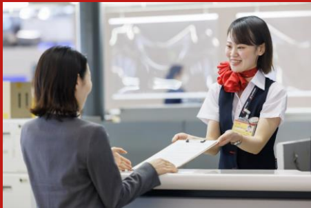
旅客サービス Passenger Service

人は空を飛ばない。グランドハンドリングで空の旅を支える。 世界と日本をつなぐ空の仕事。