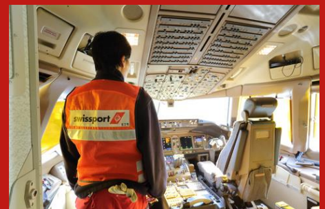
メンテナンスサービス Maintenance Service

空港でランプサービスより受け取った貨物を保管し管理します。預かった荷物を梱包や仕分け、代理店との連携を取り、お客様の元に無事に送り届ける使命を担っています。