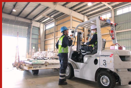
カーゴサービス Cargo Service

到着した飛行機の誘導(マーシャリング)から貨物の積み下ろし、ブリッジ操作・離陸準備(プッシュバック)・お見送りまでを出発時間までにチームで遂行します。